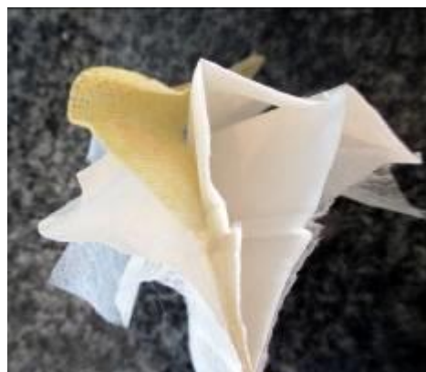
Slika 1. Prikaz ugrađenih filtrirajućih materijala u filtrirajućoj polumaski

Filtrirajuća polumaska se sastoji, u potpunosti ili uglavnom, od više slojeva filtrirajućeg materijala [13], koji može biti od nanovlakana na bazi prirodnih ili veštačkih sirovina i sa karakteristikama na veoma visokom nivou [14, 15]. Na slici 1. je dat presek jedne filtrirajuće polumaske sa prikazanim slojevima ugrađenih filtrirajućih materijala.