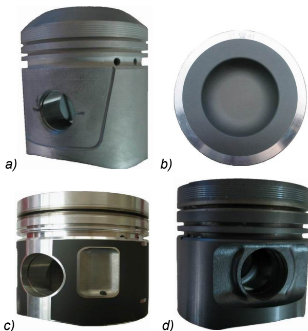
Slika 1 – Površinska obrada klipova: a). kalajisanje, debljina 3–5 \mu\text{m} , b). tvrda anodna oksidacija, debljina 40–80 \mu\text{m} , c). grafitiranje, debljina 8–20 \mu\text{m} , d). fosfatiranje, debljina 1–4 \mu\text{m} [5]

U konvencionalne metode površinske zaštite klipova spadaju: olovne prevlake, kalajisanje, fosfatiranje, grafitiranje, hromiranje i tvrda anodna oksidacija (slika 1).