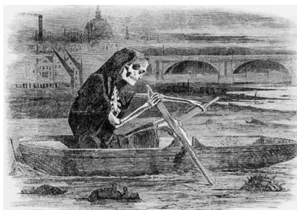
Slika 1 - Crtež iz satiričnog časopisa „Punch“ iz 1858.god. (Fohl i Ham 1985).

Frenklandu je naloženo od strane Londonske uprave da mesečno prezentuje izveštaj o vodosnabdevanju. 1868. god., povodom sastanka Kraljevskog Instituta Velike Britanije, on je istakao da je pijaća voda koja stiže u London iz Cader Idris i Plajlimon pla