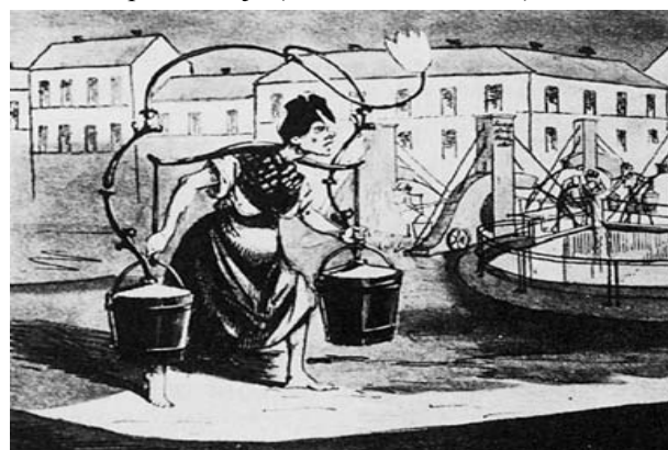
Slika 3 - Satiričan prikaz odnošenja fekalija

U 16. i 17. veku u Berlinu, propisi Izbornika i gradskog Saveta bili su uglavnom ograničeni na uklanjanje čvrstog otpada i odlaganja na gomile. U 18.veku, mnogi stanari koji nisu imali toalete u svojim dvorištima i dalje su praznili svoje posude za nuždu na ulice. Gradsko Veće Berlina zabranilo je ovo ubiranjem kazne i definisanjem liste mesta na reci Spri gde su se posude za nuždu mogle prazniti u određeno vreme u toku dana. Nakon 1830.god., sve više i više kanala za otpadne vode je građeno, neki od njih su se nalazili ispod zemlje, neki od njih su građeni kao otvoreni kanali neposredno pored trotoara. Ovi su veoma često bivali zapušeni i otpadne vode nisu mogle da otiču, naročito nakon i tokom padavina. U 19.veku, bilo je zabranjeno isprazniti posudu za nuždu u reku Spri. Očigledno, ovaj zakon je bio težak za sprovođenje (slika 3; Hosel 1990).